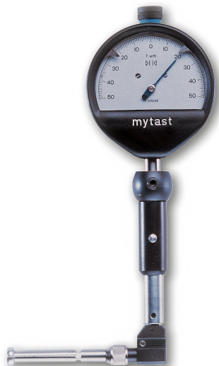
Osimes med vinkelstycke 90°

Kompleta satser för precisionsmätning av hål med diameter 1,0 – 20 mm. Levereras komplett i etui innehållande hållare med lyftknapp, mätkolvar och drivnålar i hårdmetall. Utan inställningsringar och indikator.