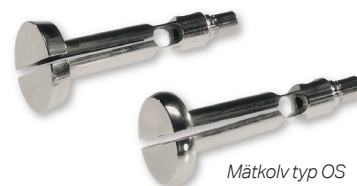
Mätkolv typ OS